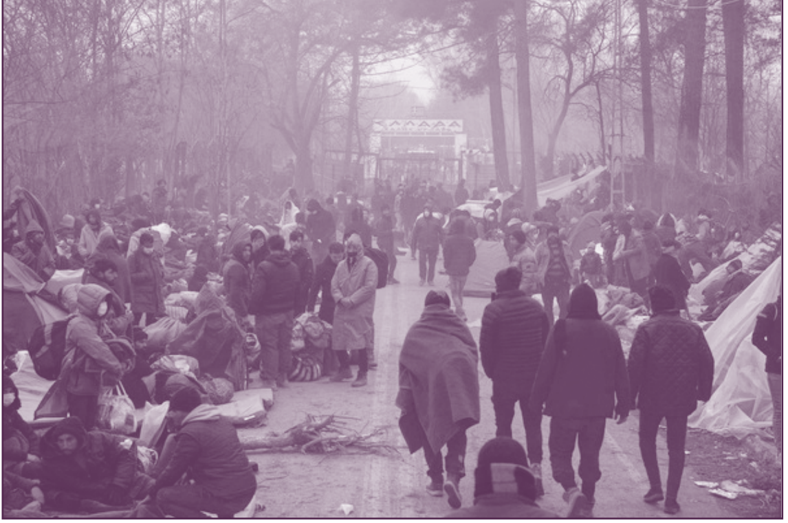
Sığınmacıların Türkiye'nin Yunanistan sınırındaki Pazarkule Sınır Kapısı'ndaki bekleyişleri -